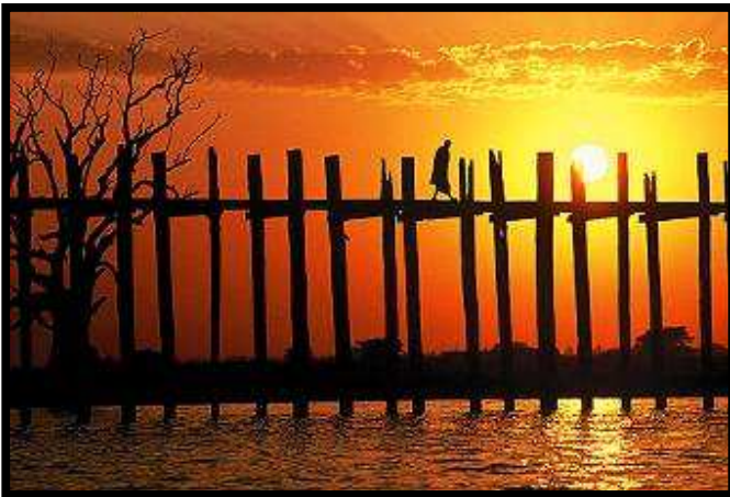
Übernachtung in Mandalay

Am heutigen Tag besuchen wir die ehemalige Königstädte Amarapura und Inwa . Zuerst besuchen sie die U-Bein Brücke – die als die längste Teakholz-Konstruktion der Welt gilt. Besuch des Mahagandayon Klosters in dem sie das Leben der Mönche kennen lernen. Nach der Mittagpause fahren wir nach Inwa und dort mit einem Pferdewagen entlang der baumgesäumten Pfade um die alten Palastmauern, das Teakholzkloster und den „ Schiefen Turm von Inwa“ zu sehen. Am Nachmittag zurück nach Mandalay.